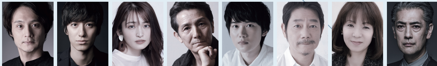
アラン・チューリング 亀田佳明 ロン・ミラー 水田航生 パット・グリーン 岡本 玲 ディルウィン・ノックス 加藤敬二 クリストファー・モーコム 田中 亨 ジョン・スミス 中村まこと サラ・チューリング 保坂知寿 ミック・ロス 堀部圭亮

美術・衣裳：山本貴愛 照明：吉本有輝子 音響：池田野歩 ヘアメイク：谷口リエ 演出助手：田丸一宏 舞台監督：川除 学 / 鈴木章友 宣伝美術：山下浩介 宣伝写真：杉能信介 宣伝ヘアメイク：高村マドカ 宣伝協力：吉田プロモーション プロデューサー：笹岡征矢 企画製作：コーチ・プラザーズ